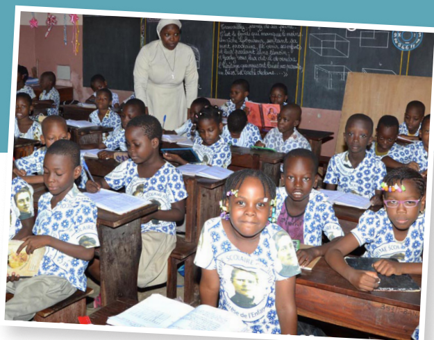
Titelbild: Besonders die Gesundheit der Frauen und Kinder liegt den Schwestern der Dienerinnen der Armen am Herzen.

missio München unterstützt die Ausbildung der Ordensfrauen bereits seit neun Jahren. Um die