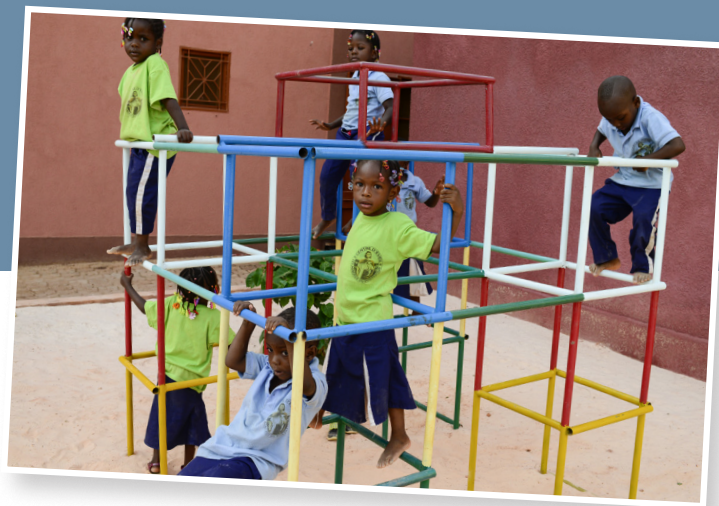
Im Kindergarten und der Krippe des Zentrums werden auch Kinder aus der Umgebung betreut.

Titelbild: Mit viel Einfühlungsvermögen gewinnen die Schwestern das Vertrauen der oft traumatisierten Mädchen.