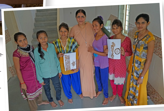
Titelfoto: Die Förderung von Mädchen liegt den Karmel-Schwestern besonders am Herzen.

Für einen Teilabschnitt des großangelegten Schulbauprojektes bittet die langjährige Projektpartnerin missio München um einen Beitrag in Höhe von 80.000 Euro.