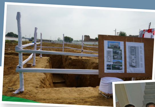
Foto oben: Im November 2019 wurde mit den umfangreichen Aushubarbeiten für die verschiedenen Gebäudekomplexe auf dem Schulareal begonnen.

Auf einem von der Kongregation bereits im Jahr 2016 erworbenen 16.000 m 2 großen Gelände, soll in den nächsten Jahren eine schulische Infrastruktur mit Kindergarten, Vorschule und einer Schule von der ersten bis zur zwölften Klasse für Kinder aus Dharuhera und Umgebung entstehen.