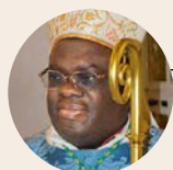
Bischof Charles J. S. Kasonde